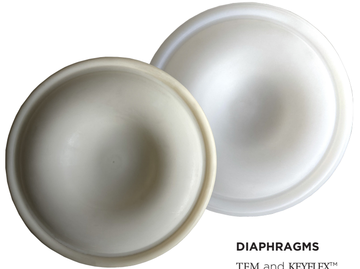
DIAPHRAGMS TFM and KEYFLEX™

QUANTUM-S 펌프구조는 샤프트와 직결방식이 아닌 홀(hole)이 없는 비접촉방식의 다이어프램이 적용됩니다. 이 구조는 혹독한 케미컬 조건에서도 안전하고 내구성을 보장하며, 유지관리가 용이합니다.